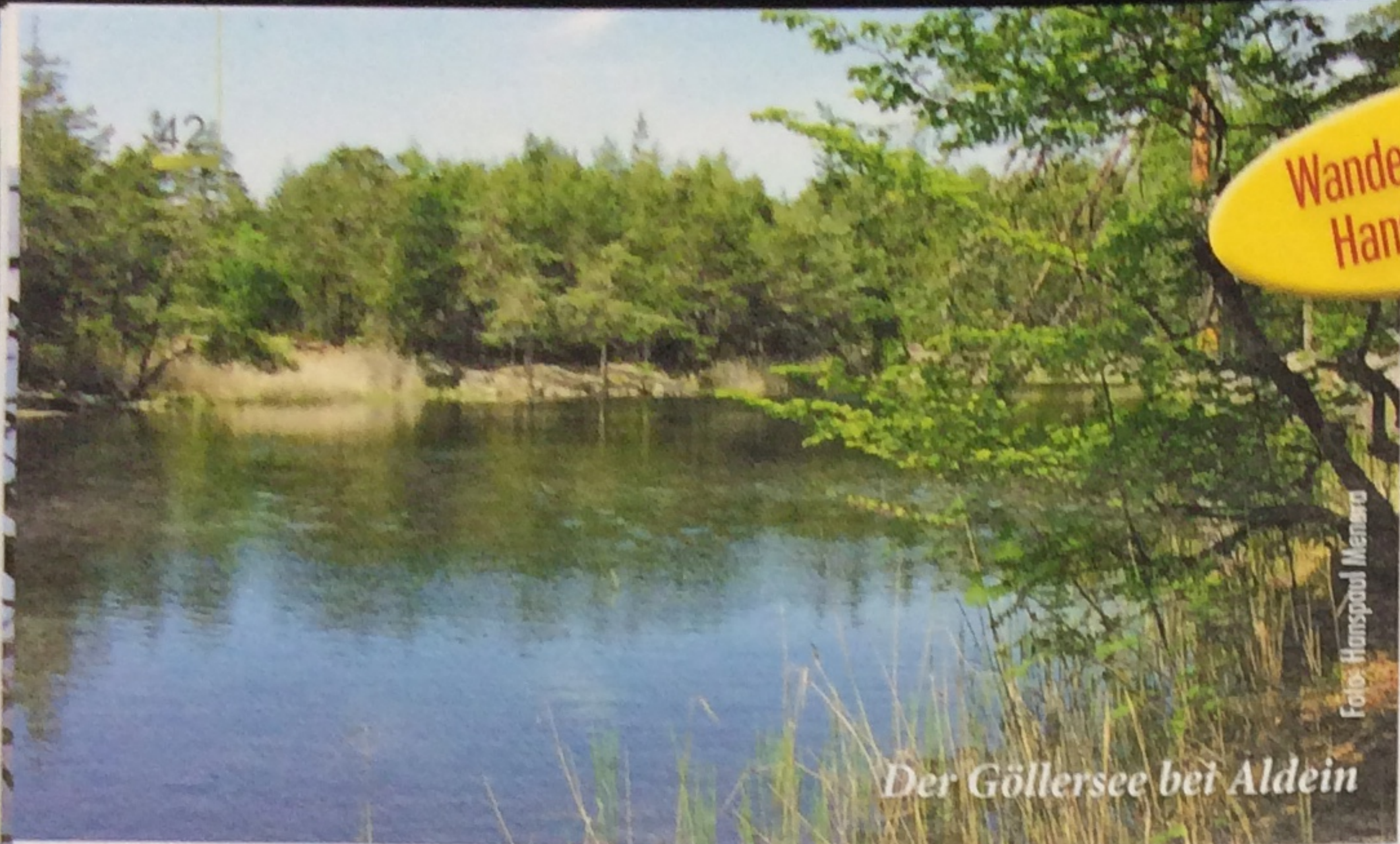
Der Göllessee bei Aldein